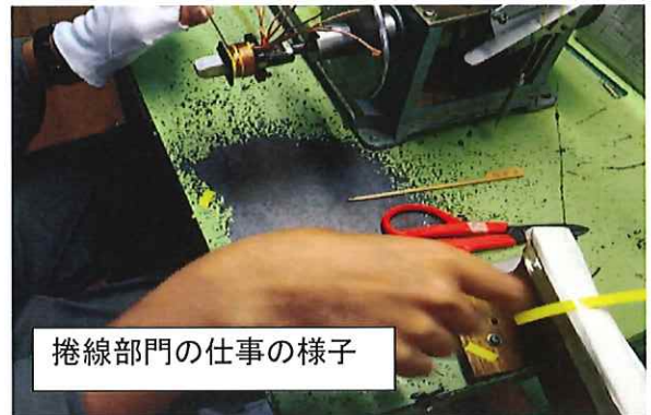
捲線部門の仕事の様子